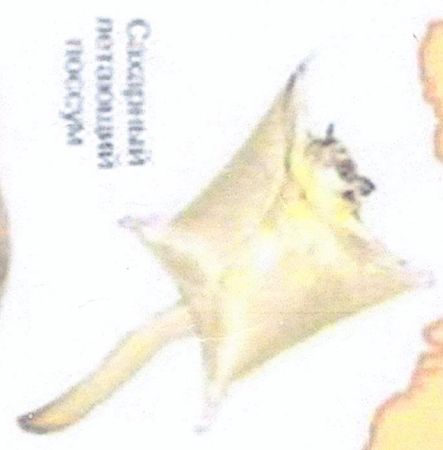
Сакрипий портонунан ноокум